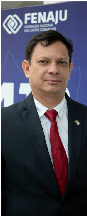
comerciais do Brasil

Vimos a Curitiba com os profissionais que são os responsáveis pelas áreas de registro mercantil a fim de buscar conhecimento e trocar experiências, haja vista que neste ano a Jucetins esteve entre as Juntas mais rápidas do Brasil para registrar empresas. Neste evento participamos ativamente das discussões para que possamos unificar entendimentos, alinhar ações e padronizar procedimentos com todos as juntas