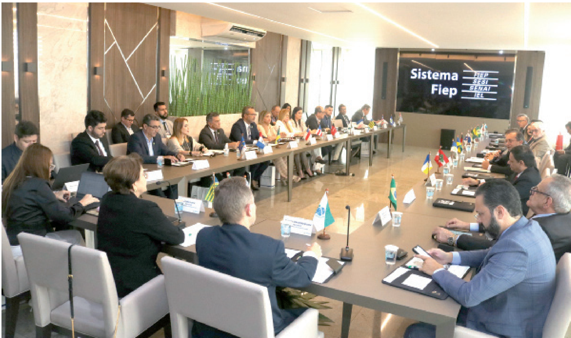
Reunião dos presidentes das juntas comerciais