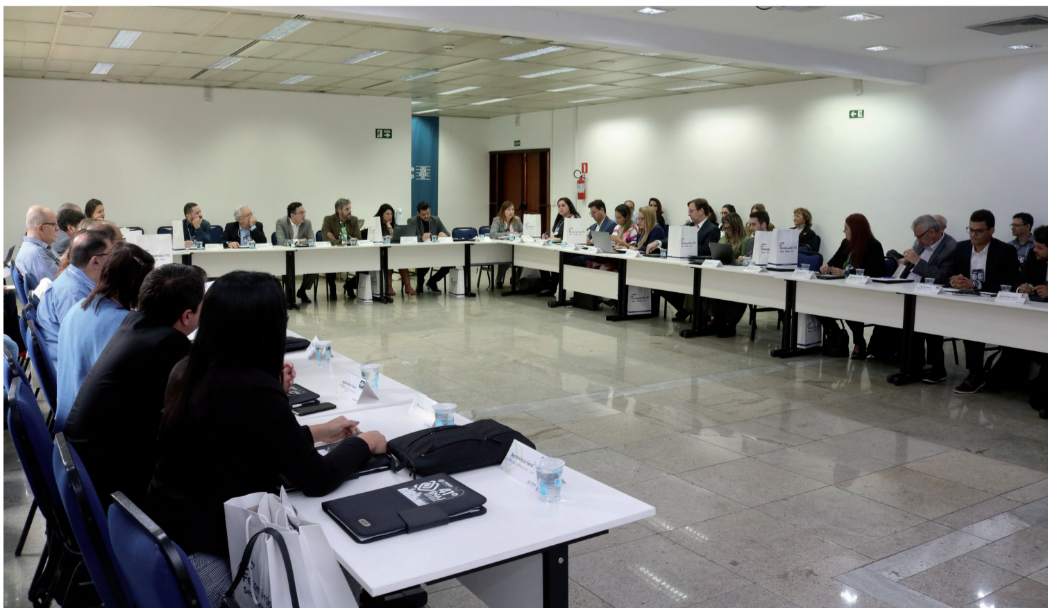
Reunião de secretários gerais e procuradores das juntas